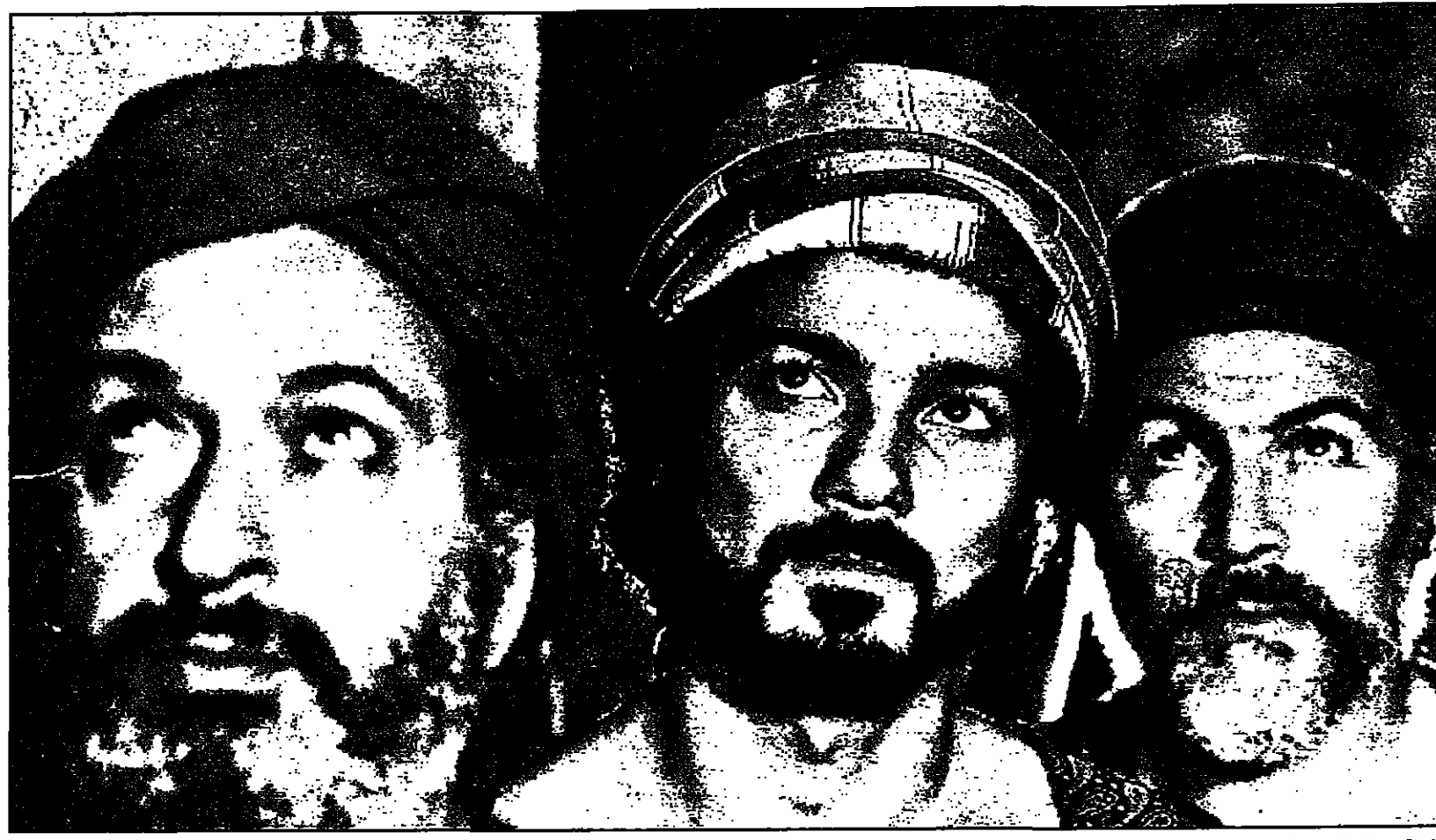
لقطة من فيلم «السيرو» ليوست شامخ

وكان أول المتحدثين الكاتب أسامة أنور عكاشة الذي عرف الفيلم العربي بأنه هو المنتج برأس مال عربي ويتحدث عن موضوع عربي، عكبه عربي وأخرجه عربي ومثله ممثلون عرب وكافة الخدمات الفنية فيه خدمات عربية.